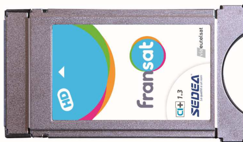
Fabricant du module : SEDEA Modèle du module : Fransat CI+ 1.3