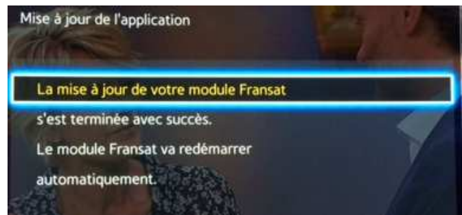
Fin de mise à jour et redémarrage du module