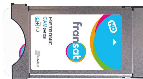
Fabricant du module : METRONIC Modèle du module : CAMSAT CI+ 1.3