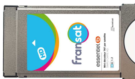
Fabricant du module : ESSENTIEL B Modèle du module : Mini décodeur