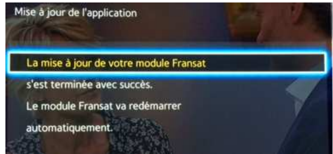
Fin de mise à jour et redémarrage du module